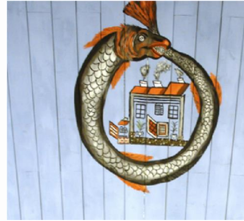
Nr. 8