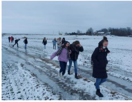
Nr. 5 Partizanų kovos ir žūties vieta, esanti Uniūnuose ir akimirkos iš kelio link vietos