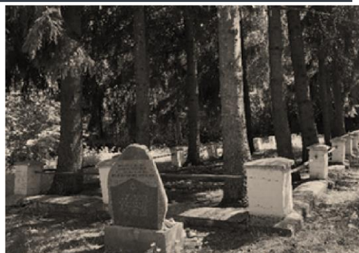
Genocido vieta Morkakalnyje (Pakruojo r.)