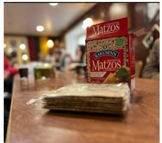
Nr. 3 Matzo