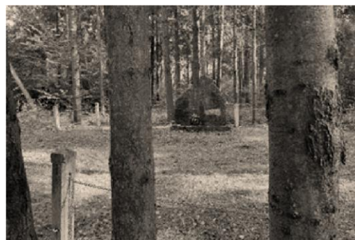
Genocido vieta Juknaičiuose. Čia nužudyta apie 250 Lygumų miestelio žydų.

1974 m. statant užtvanką Pakruojyje – Puzinkalnis atsidūrė po vandeniu. Kai kurie senieji pakruojiečiai mena, kad, prieš užtvėnkiant Kruoją, nužudytųjų palaikai buvo perlaidoti į Morkakalnį, kuriame nužudyta apie tris šimtus žydų. Aukų atminimas gerbiamas ir Veselkiškių Atkočiūnmiškyje, žiūrėti paskutiniajame puslapyje) Čia karo nusikaltėliai sušaudė tris šimtus Linkuvoje gyvenusių žydų moterų bei vaikų. Dvariukuose nužudyti per šimtą šeimų vyrų. Juknaičių miške nužudyta pustrėčio šimto Lygumų miestelio žydų. Vileišiuose atgulė šimto šešiasdešimties Žeimelio žydų palaikai.