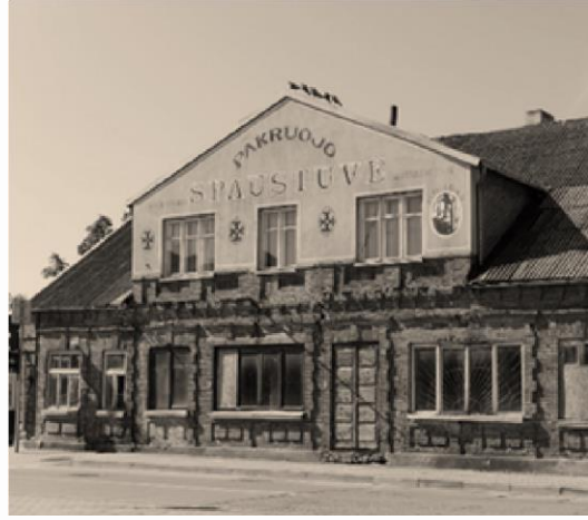
Gyvenamasis brolių Maizelių namas, kuriame po karo buvo atidaryta spaustuvė.

Žydai Maizel'iai buvo turtingi Pakruojo pramonininkai, dirbę dvaro malūne, o vėliau malūną pastatę pačiame miestelyje. Brolių žydų pastatytas malūnas, nepaisant sunkaus laikotarpio, sparčiai plėtėsi ir, vykdant ne vieną rekonstrukciją, greitai išaugo į respublikinės reikšmės Pakruojo malūno kompleksą. Su naujausiomis technologijomis jame buvo gaminama apie 70 proc. respublikai reikalingų miežinių kruopų, miltų. Būtent šio malūno produkcija buvusi pati geriausia apskrityje. Malūno kompleksą sudarė laboratorija, mechaninės dirbtuvės, džiovykla, garažai, lentpjūvė, pirtis, klubas su biliardine, biblioteka, 5 gyvenamieji 20-ties butų namai ir kiti statiniai. Nuo atidarymo dienos malūne dirbo apie 80 miestelio gyventojų – ne žydų. Vėliau veikla plėtėsi ir darbuotojų buvo priimta daugiau. Apie sėkmingą verslą bylojo ir brolių turimas tuo metu neįtikėtinais brangus įrenginys – Skoda elektros generatorius.