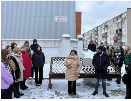
Nr. 4 Susitikimas su žyde iš Izraelio