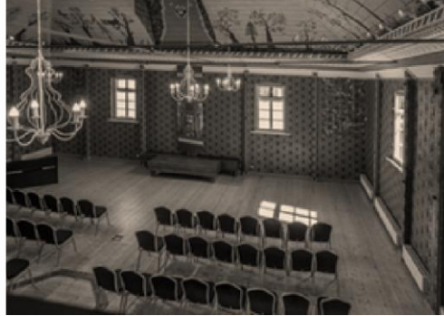
Sinagoga po restauracijos

Medinę sinagogą (dar vadinama „šule“), stovinčią ant Kruojos upelio kranto, žydų bendruomenė pasistatė apie 1801 metais. Tai buvo vasarinė sinagoga, skirta naudotis šiltuoju metų laiku. Pagrindinėje patalpoje stovėjo aron kodešas ir bima (Nr. 6, žr. gale) : išskirtinai puošnūs, drožinėti iš medžio ir dažyti. Abu šie statiniai, deja, neišliko. Pergyvenusi du pasaulinius karus, ne vieną gaisrą – išliko iki šių dienų. Sinagoga - ne tik seniausias pastatas Pakruojuje, bet ir seniausia medinė sinagoga Lietuvoje. Po Antrojo pasaulinio karo, žuvus čia gyvenusiai žydų bendruomenei, sinagogos paskirtis tapo kita. Kurį laiką čia buvo kino teatras, vėliau – sporto salė,