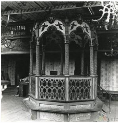
Nr. 6 Bima.