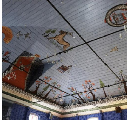
Nr. 10