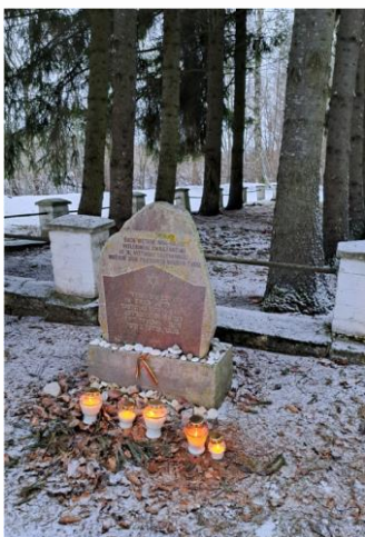
Nr. 1 Morkaklnio kapinės.