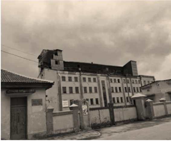
Brolių Maizelių grūdų malūnas