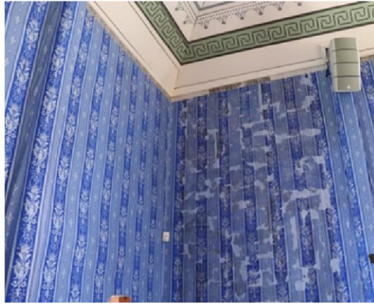
Nr. 7 Nuotr. Gitana Maasienė