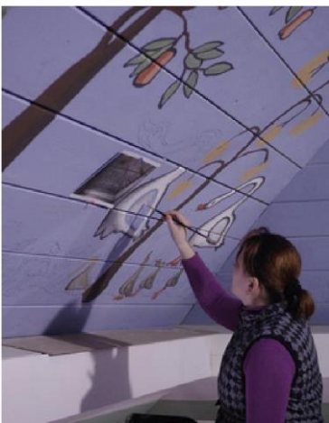
Nr. 9