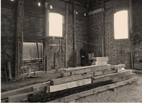
Sinagoga restauracijos metus